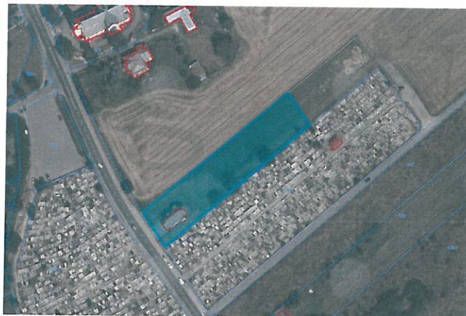
Rysunek Nr 1. Zakres przestrzenny wniosku o rozszerzenie cmentarza.

Istniejący cmentarz parafialny w Trześni znajduje się na działkach nr ewid. 643 (stary cmentarz) oraz 714/2 (nowy cmentarz), po obu stronach drogi powiatowej Nr 1090R. Na przestrzeni lat, oba zostały wypełnione prawie w całości, niezbędne jest wyznaczenie obszaru pod rozszerzenie funkcji grzebalnej. Teren proponowany do rozszerzenia cmentarza o powierzchni ok. 0,4ha, wskazany został na części działki nr ewid. 644/1, tj. na północny-zachód od terenu istniejącego cmentarza. Teren ten został ogrodzony (co jest jednym z wymogów dla tego rodzaju inwestycji) wybudowano tu nową kaplicę, pozostała część uprawiana jest rolniczo, okresowo służy jako parking. Zakres przestrzenny przedstawiono na Rysunku 1 - kolorem błękitnym.