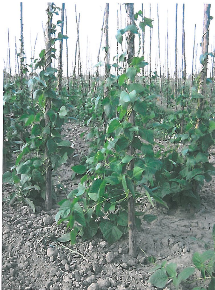
Fasola wrzawska (Piękny Jaś)

Każda z imprez „W widłach Wisły i Sanu” jest inna, chociaż łączy je wiele wspólnych elementów. Myślą przewodnią jest tutaj Fasola wrzawska - „Piękny Jaś”, główny produkt, jakim - z racji jego szczególnych walorów, szczyli się ten region.