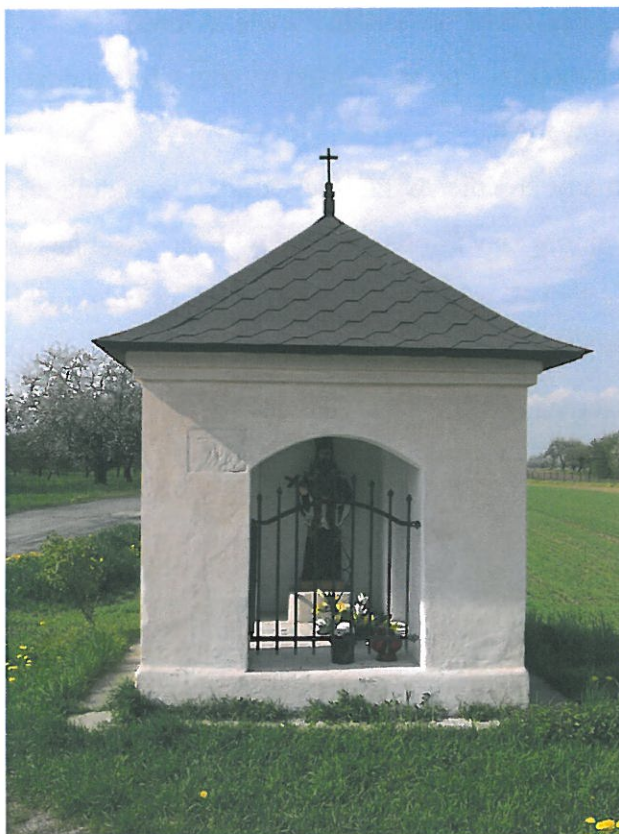
Wrzawy. Kapliczka naprzeciw cmentarza grzebalnego, mur., II poł. XIX w.

Po lewej górnej stronie kapliczki widnieje wyryty napis: 1888, a pod nim kreska upamiętniająca stan ówczesnej wody powodziowej. Według relacji mieszkańców figura św. Jana (drewniana) znajdująca się pierwotnie w kapliczce przyplęnęła Sanem podczas powodzi.