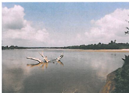
Ujście Sanu do Wisły w miejscowości Wrzawy