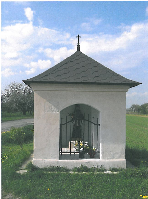
Wrzawy. Kapliczka naprzeciw cmentarza grzebalnego, mur., II poł. XIX w.

Po lewej górnej stronie kapliczki widnieje wyryty napis: 1888, a pod nim kreska upamiętniająca stan ówczesnej wody powodziowej. Według relacji mieszkańców figura św. Jana (drewniana) znajdująca się pierwotnie w kapliczce przyplęnęła Sanem podczas powodzi.