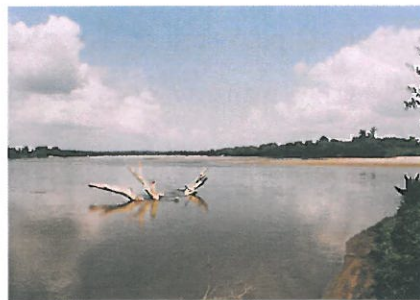
Ujście Sanu do Wisły w miejscowości Wrzawy